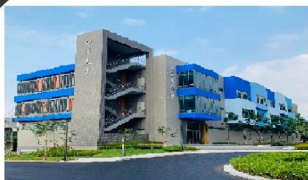
桃園市中壢區新中北路499號